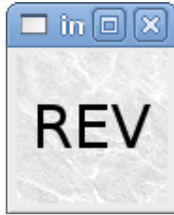
FIGURE 9.2 – selectimage vraie