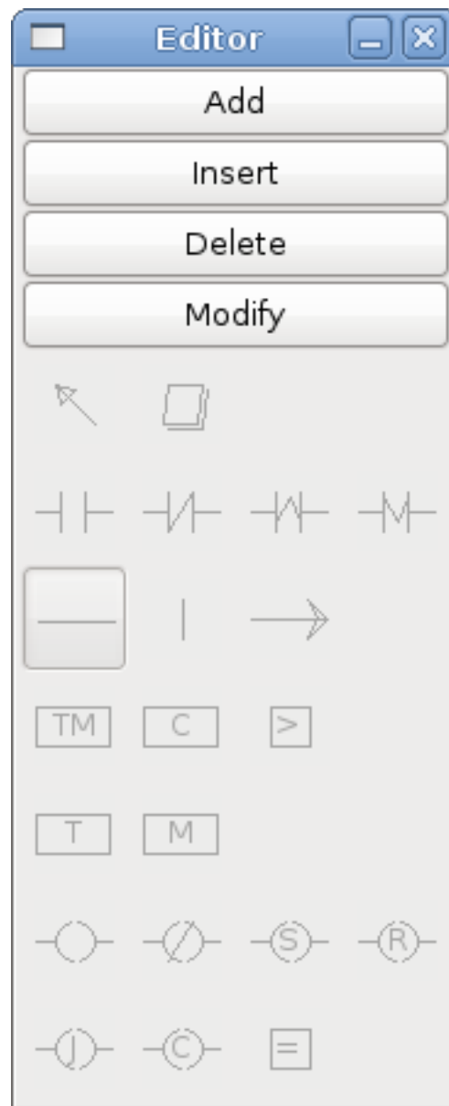
FIGURE 18.6 – Editor Window