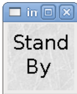
FIGURE 9.3 – Halpin = 0

Même résultat mais en ajoutant l'image stb.gif.