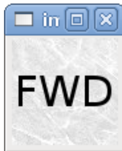
FIGURE 9.1 – selectimage fausse

En utilisant les deux images fwd.gif et rev.gif, FWD est affiché quand selectimage est fausse et REV est affiché quand selectimage est vraie.