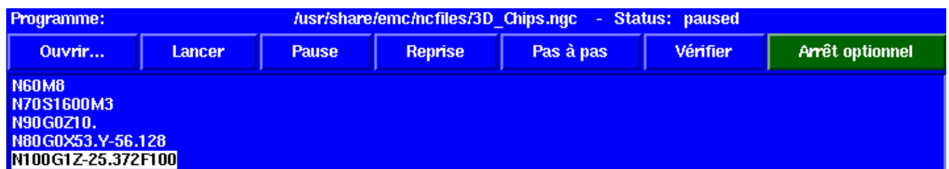
FIGURE 6.2 – Interpréteur de TkLinuxCNC