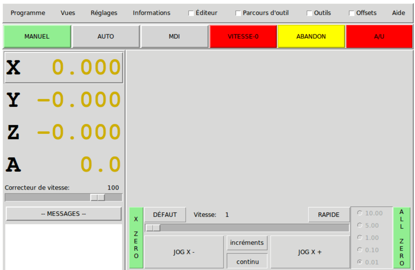
FIGURE 7.1 – L'interface graphique Mini

Mini a été prévu pour être une interface graphique plein écran. Il a été écrit initialement pour Sherline CNC mais est disponible pour ceux qui veulent l'utiliser, le copier le distribuer selon les termes de la GPL.