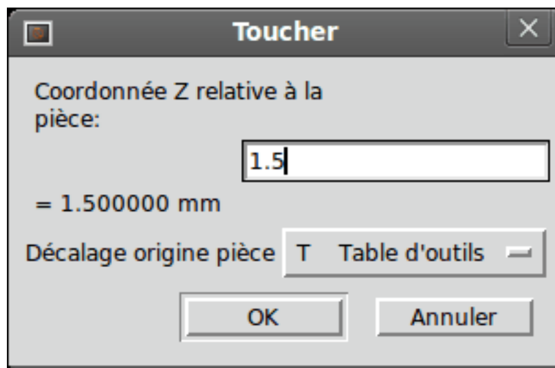
FIGURE 12.1 – Toucher et table d'outils

La table d'outil sera alors modifiée avec la longueur correcte en Z de l'outil. La visu affichera la position en Z correcte et une commande G43 sera passée pour que la nouvelle longueur Z de l'outil soit effective. Le choix Table d'outils n'apparaîtra dans la liste déroulante du Toucher , que si l'outil à été chargé avec Tn M6 .