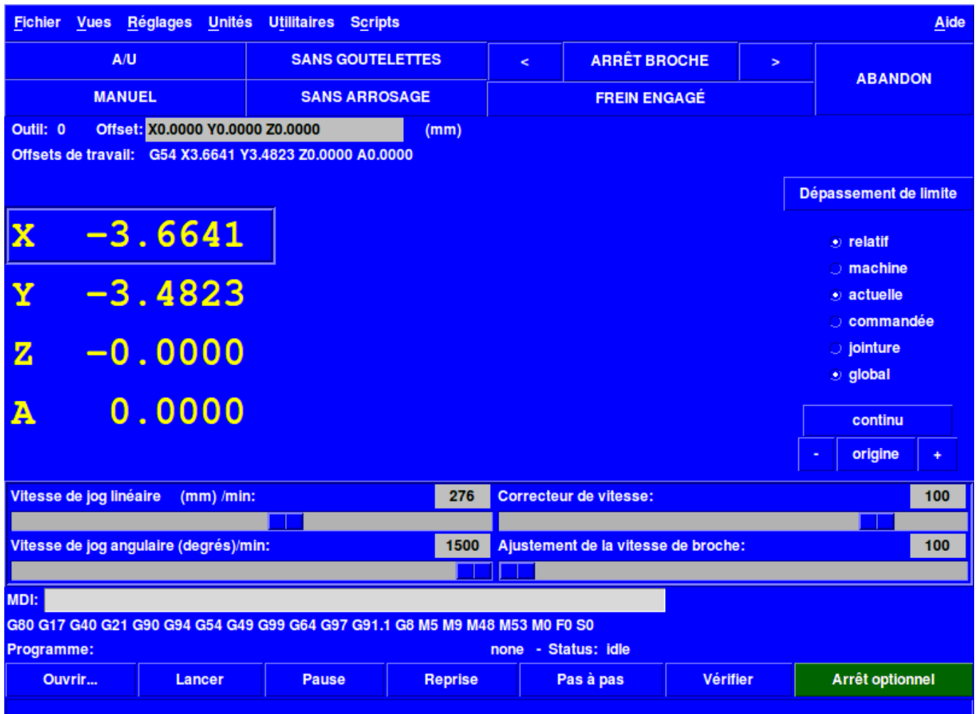
FIGURE 6.1 – L’affichage de TkLinuxCNC