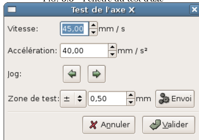
FIG. 5.5 – Fenêtre du test d'axe