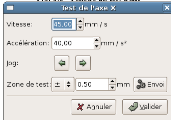
FIG. 5.5 – Fenêtre du test d'axe